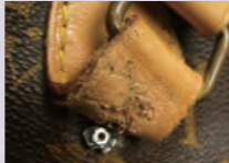
ボタンが取れている 金具が壊れている