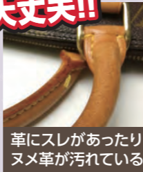
革にスレがあったり ヌメ革が汚れている